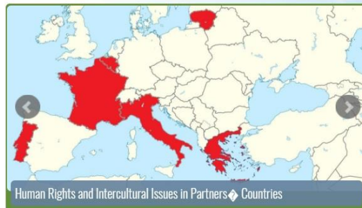
Human Rights and Intercultural Issues in Partners Countries

Towards the Recognition of Non-discrimination Principles at School